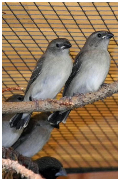
Jungtiere 3 Tage nach dem Ausfliegen

Als Baumaterial reiche ich braune Kokosfaser, trockene Gartengräser, Halme und eine Nistmaterialmischung aus Sisal, Jute und Baumwolle. Innerhalb von 3 – 4 Tagen waren die Nester errichtet. Einen Tag nach der Fertigstellung des Nestes konnte ich beim ersten Paar das erste Ei im Nest feststellen. In dieser Zeit stellte ich fest, dass die Männchen jeden ungebetenen Gast aus der Nestnähe vertrieben haben. Am Tage kommt es oft zur Brutablösung.