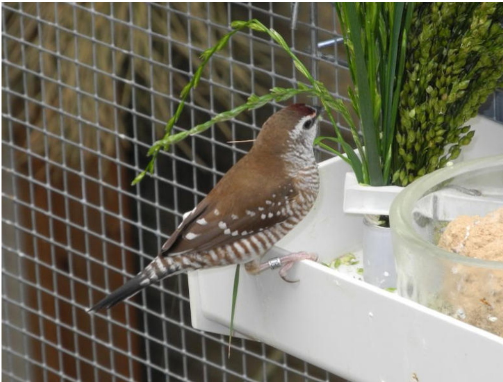
0,1 am Grünfutter, Silberhirse und Gras