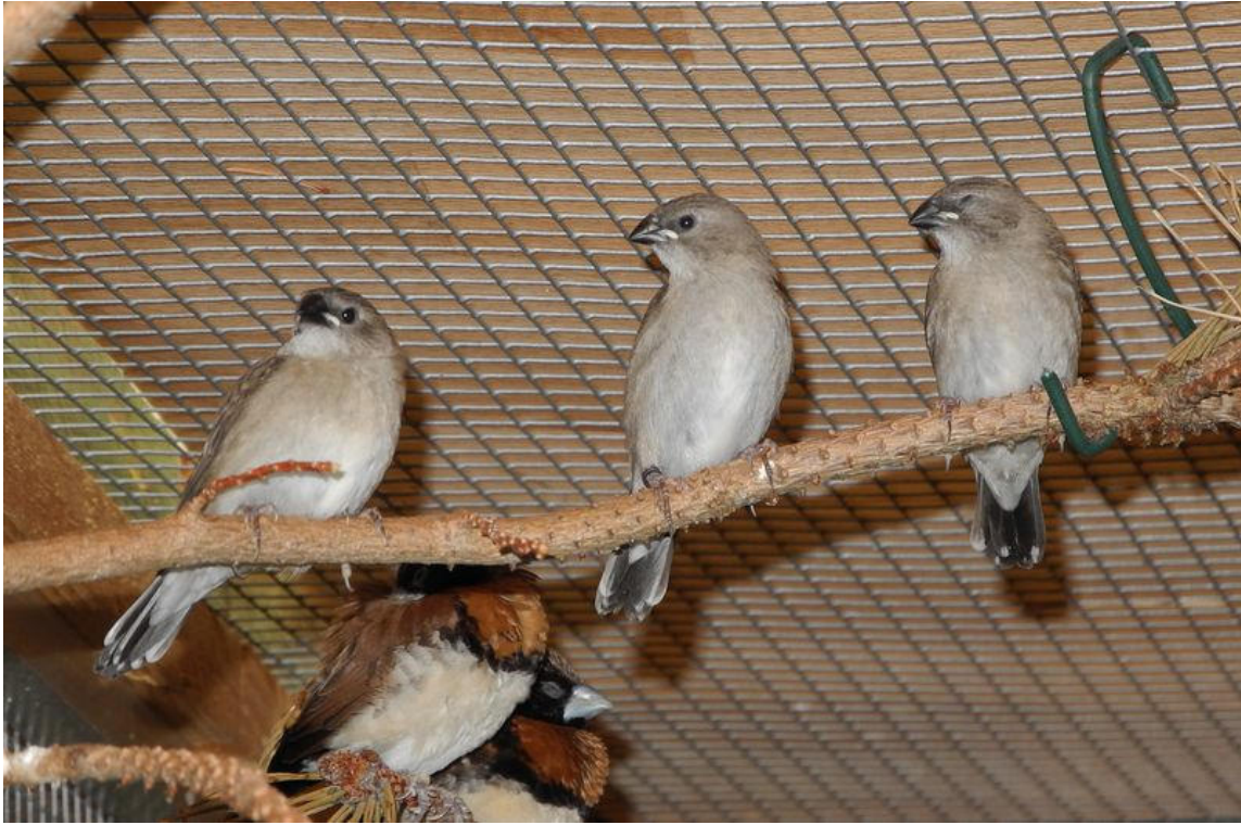
Jungtiere 6 Tage nach dem Ausflug.

Aus der Literatur geht hervor, dass die Brutzeit bei 13 Tagen liegt. Die Nestlingszeit wird mit 21 Tagen angegeben. Nach meinen Aufzeichnungen und Rückrechnungen müssten die Angaben so stimmen.