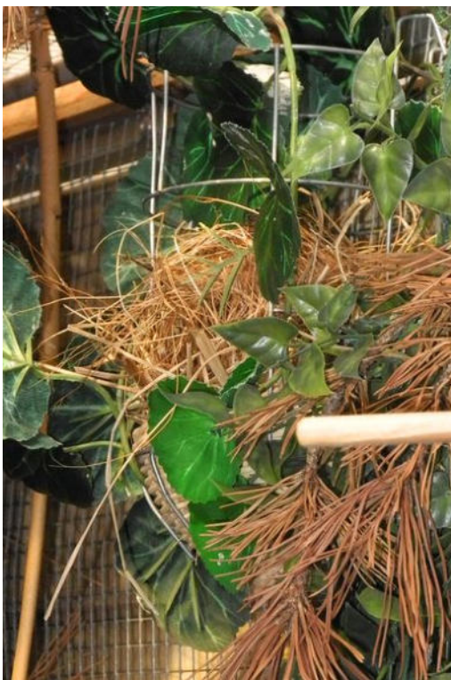
Nest in eine Drahtnisthilfe gebaut