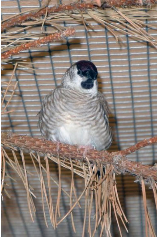
1,0 Zeresamadine wildfarben, Wellenzeichnung im Brustbereich blassbraun

Zeresamadinen kamen 1872 erstmals nach Deutschland. Die Einfuhr war recht regelmäßig, aber nie häufig und in großen Stückzahlen. Zur Verbreitung die folgenden Infos. Die Zeresamadine kommt im inneren östlichen Teil Australiens vor. Von Mittelqueensland südwärts bis zum südlichen New South Wales. Sie bewohnt das Grasland, die lichten Trockensavannengebiete und Buschland in der Nähe von Wasserläufen oder auch Sümpfen mit Schilfbeständen. Auch auf Feldern und in Obstplantagen sind Zeresamadinen zu finden.