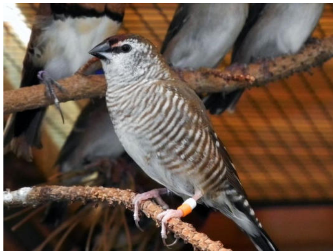
0,1 Zeresamadine wildfarben

Die visuellen Merkmale . Zeresamadinen zählen zu den mittelgroßen Prachtfinken. Sie haben eine Größe von 10 – 11 cm. Die Körperfarben und Zeichnung von Männchen und Weibchen ähneln sich sehr stark. Lassen sich aber auf Grund deutlicher Merkmale recht gut unterscheiden. Ich möchte auf eine allgemeine Beschreibung verzichten, denn die Bilder sprechen für sich.