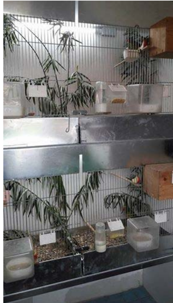
Zuchtboxen für die Lorizucht - Größe 100 x 150 x 90

Das Gelege der Irisloris besteht aus 2 Eiern, so wie bei den meisten anderen Loriarten auch. Die Aufzuchtperiode beträgt etwa 52 bis 55 Tage. Nach dem Ausfliegen werden die Jungvögel noch 3 bis 4 Wochen von den Eltern gefüttert.