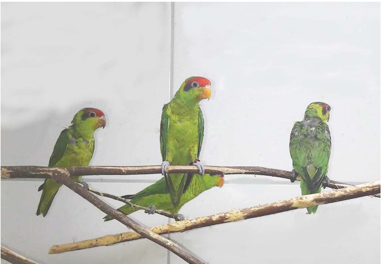
Hier ein Elternpaar mit Jungvögel

Als Grünfutter reiche ich Salatblätter, Vogelmiere, Löwenzahn und was der Garten noch an Grünfutter hergibt.