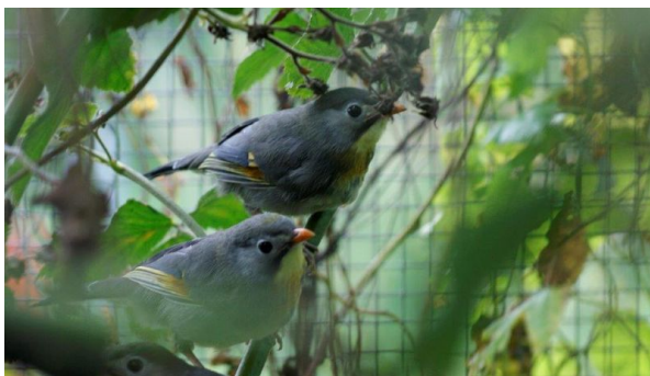
junge Sonnenvögel im Geäst

Das Gelege besteht meistens aus 4. Eiern. Die Brutzeit beträgt 13 Tage. Es werden dann kleine Mehlwürmer und Pinkys gefüttert, nach einigen Tagen auch Hermetia und Drohnen. Ca. 4 Tagen nach dem Schlupf werden die Jungvögel mit 3,0 mm beringt. Die Ringe habe ich mit Hansplast umklebt, damit die Ringe von den Eltern nicht erkannt werden. Nach ca. 11 bis 13 Tagen verlassen die jungen Sonnenvögel das Nest. Sie werden noch ca. 14 Tagen gefüttert.