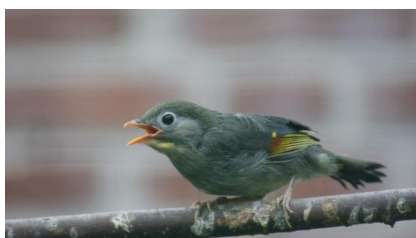
Schimpfender junger Sonnenvogel