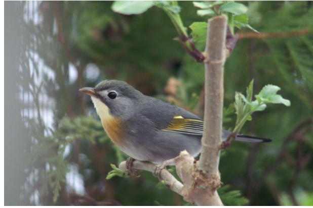
Zuchtweibchen im Winter (dkl. Schnabel)

Im Jahr 1995 erwarb ich meine ersten Sonnenvögel, sie gehören zur Familie der Timalien. Er wird auch Chinesische Nachtigall genannt, obwohl er nicht zu den Nachtigallen gehört. Die Größe beträgt ca. 16 cm. Das Gefieder ist dunkelolivgrün und zum Rücken hin etwas gräulicher. Der Bauch der Vögel ist in einem schönen Grau gefärbt, was zum Schwanz hin etwas blasser wird. Beide Geschlechter haben ein orangefarbiges Brustband, die Kehle goldgelb, wobei der Hahn stärker gefärbt ist. In der Ruhephase haben die Sonnenvögel dunkle Schnäbel, zur Brutzeit mehr orange.