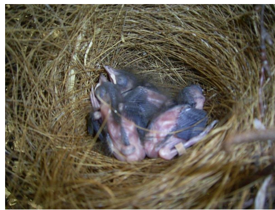
Freistehendes Nest mit Jungtieren

Das Gelege besteht meistens aus 4. Eiern. Die Brutzeit beträgt 13 Tage. Es werden dann kleine Mehlwürmer und Pinkys gefüttert, nach einigen Tagen auch Hermetia und Drohnen. Ca. 4 Tagen nach dem Schlupf werden die Jungvögel mit 3,0 mm beringt. Die Ringe habe ich mit Hansplast umklebt, damit die Ringe von den Eltern nicht erkannt werden. Nach ca. 11 bis 13 Tagen verlassen die jungen Sonnenvögel das Nest. Sie werden noch ca. 14 Tagen gefüttert.