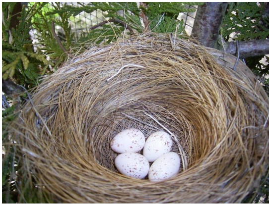
Nest mit Unterlage (Körbchen)

Die Nester werden in Lebensbäumen und Holunderbüsche gebaut. Als Nistmaterial gebe ich Kokosfasern, Gräser und Klempnerhanf, die ich in verschiedene Längen geschnitten habe. Durch die Hanffasern werden die Nester super stabil gebaut.