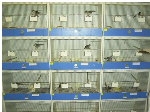
Meine jungen Sonnenvögel - Einzelunterbringung zur Geschlechterbestimmung Männchen singen, Weibchen rufen nur

Nach dem Selbstständigwerden fange ich die Jungvögel aus der Voliere, damit sie bei der nächsten Brut nicht stören. Die jungen Männchen fangen dann auch schon langsam an zu Singen. Nach 25 Jahren erfolgreicher Zucht des Sonnenvogels habe ich 2021 aufgehört, diese Art zu züchten.