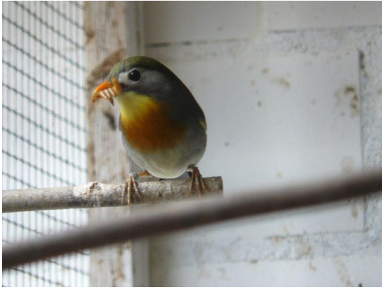
Zuchthahn mit Mehlwurm