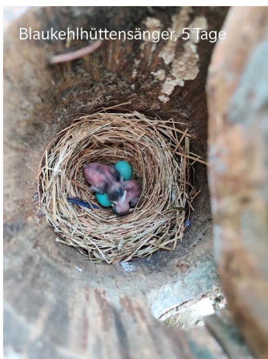
Blaukehlhüttensänger, 5 Tage

Nach der Eingewöhnung bezogen sie eine Innenvoliere mit Ausflug in einer Außenvoliere. Ich habe zwei Nistkästen aufgehängt. Als Nistmaterial gab ich Kokosfasern, Heu, Halme und Klempnerhanf. Das Männchen jagte das Weibchen durch die Voliere, was wohl so eine Art Balz war. Das Nest wurde in kurzer Zeit in einem Nistkasten gebaut. Nach einer Nestkontrolle sah ich 5. hellblaue Eier. Nach 13 Tagen schlüpften 2. Junge. Die anderen Eier waren unbefruchtet.