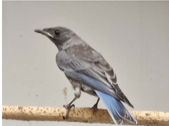
Jungvogel 40 Tage 0,1

Bei der zweiten Brut zogen die Blaukehlhüttensänger noch einmal zwei Junge groß. Ich gab bis auf ein junges Männchen alle ab. Bei einem Zuchtfreund habe ich ein junges Weibchen getauscht. In diesem Jahr 2021 sind die Vögel in der Zucht. Das neue zusammengesetzte Paar hat im Augenblick 5. Junge. Die Eltern füttern perfekt.