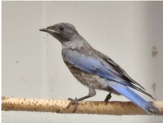
Jungvogel 40 Tage 1,0

Zuerst gab ich kleine Mehlwürmer, kleine Heimchen und Pinky's. Am 6. Tag wurden die Jungen beringt. Ich gab jetzt auch Soldatenfliegenmaden und mittlere Heimchen, sie wurden auch gerne genommen. Zweimal die Woche gab ich einen Tropfen Lebertran auf ausgesuchte weiße Mehlwürmer, da die Vögel diese am Liebsten fraßen. Ich gab noch Mineralien und Vitamine über diese weißen Mehlwürmer. Die Jungen wuchsen sehr gut, flogen aber erst nach 21. Tagen aus dem Nistkasten. Ich war überrascht, dass die Jungvögel gleich sehr gut fliegen konnten.